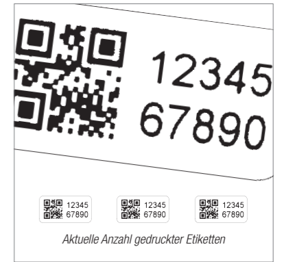
Ultra hohe 600 x 1200 dpi Auflösung durch Microschritt-Antriebstechnik