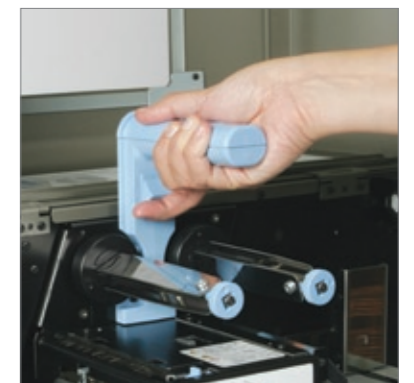
Ein vertikal anhebbarer Kopf für einfachen Zugang