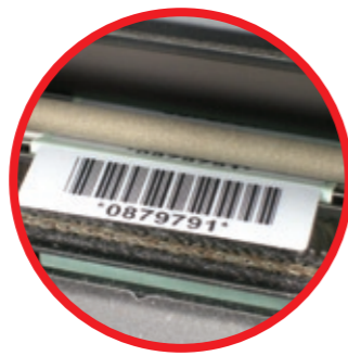
Faszinierende Spendemodule, die schon mit Etiketten von gerade einmal 10 mm Höhe arbeiten